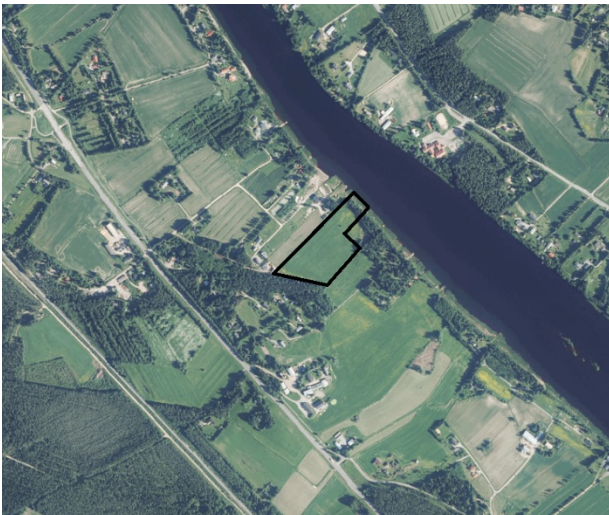
Kuva 1. Ote orthoilmakuvasta (Muhoksen kunnan karttapalvelu). Suunnittelualue rajattu mustalla viivalla.

Suunnittelualue sijaitsee Muhoksen kunnassa Murtomäen kylässä Oulujokivarressa. Valtatien pohjoispuolella. Kaavamuuotosalue on yksityisen maanomistajan omistuksessa ja sen koko on noin 3 ha. Suunnittelualan sijainti, rajausta ja arvioitu vaikutusalue on esitetty kansilehden kartassa.