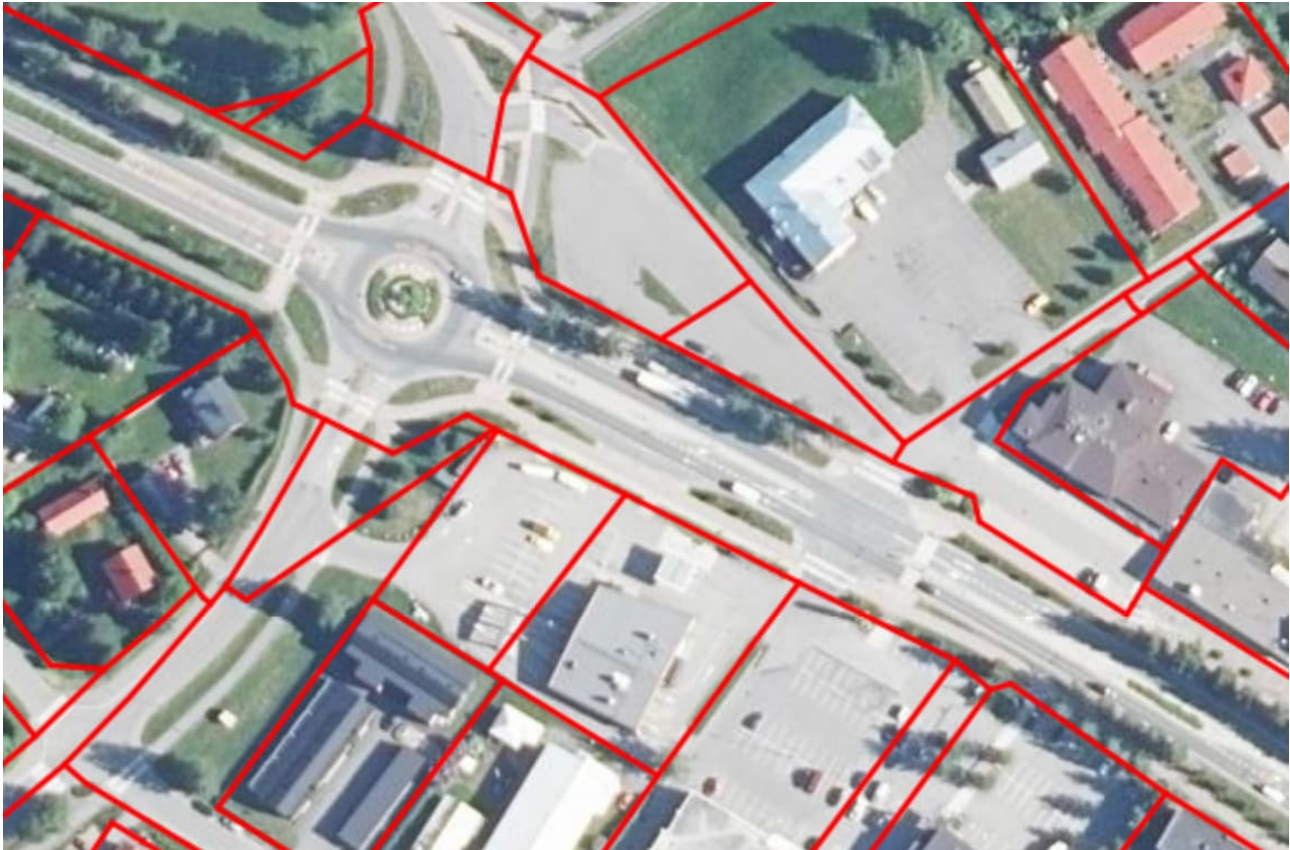
KUVA 3. Kiinteistörajat