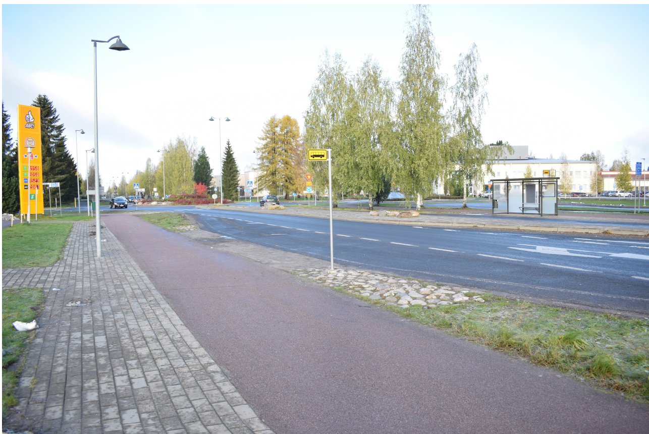
KUVA 2. Pysäkit